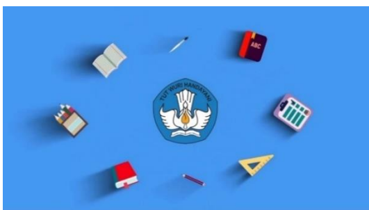
Gambar 1. Tampilan Video Pembuka

Video animasi berbasis plotagon dikembangkan mengacu sesuai rancangan sebelumnya. Video animasi dikembangkan berjumlah 5 video 6 scene dengan durasi setiap video adalah video pertama 4 menit 51 detik, video kedua 6 menit 42 detik, video ketiga 6 menit 29 detik, video keempat 3 menit 50 detik dan video kelima 4 menit 34 detik yang akan dipakai untuk 3 pertemuan pembelajaran. Berikut ini tahap pengembangan yang dilakukan: