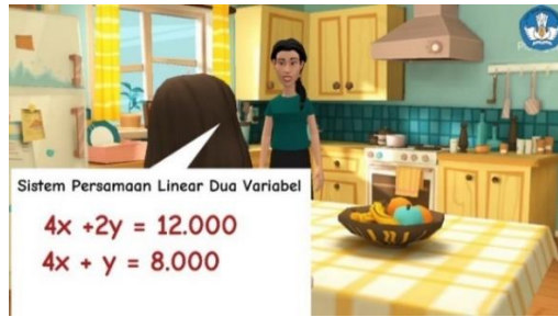
Gambar 4. Tampilan Scene Penyajian Materi Video 1