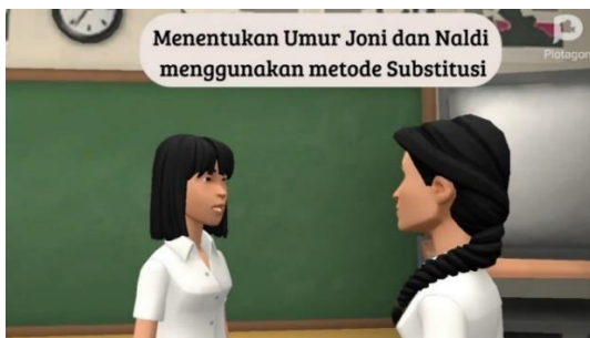
Gambar 7. Scene Penyajian Materi Video 4