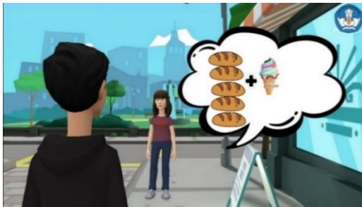
Gambar 3. Tampilan Scene Penyajian Materi Video 1