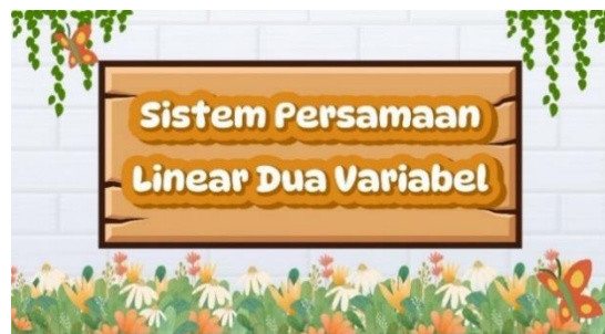
Gambar 2. Tampilan Judul Video