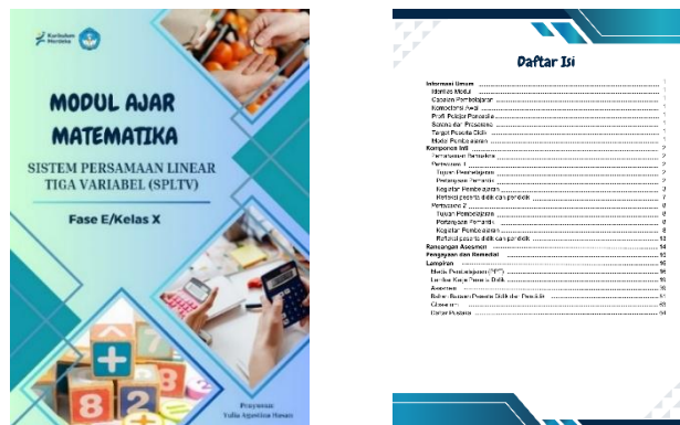
Gambar 1. Pembuatan Draft Modul

Selanjutnya modul ajar divalidasi dengan meminta penilaian dari para ahli setelah disetujui oleh dosen pembimbing. Proses validasi ini melibatkan lima dosen dari jurusan matematika serta satu guru mata pelajaran matematika. Hasil penilaian modul oleh ahli materi dan pembelajaran dapat dilihat pada Tabel 7, sementara validasi dari ahli desain ditunjukkan pada Tabel 8.