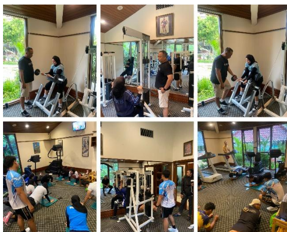
Gambar 4. Pendampingan Pelaksanaan Program Latihan di Fase Adaptasi Anatomi pada Atlet Pelatnas Bolavoli Duduk Indonesia

Setelah serangkaian tahapan tes antropometri dan tes kondisi fisik dilaksanakan, selanjutnya tim pengabdian kepada masyarakat berkolaborasi dengan pelatih serta tim pendukung untuk menyusun program latihan fase adaptasi anatomi ( anatomical adaptation phase ). Fase ini merupakan tahapan awal yang sangat utama dalam periodisasi latihan kekuatan yang berfungsi untuk mempersiapkan struktur otot, tendon, dan ligamen terhadap beban latihan intensif pada fase berikutnya ( strength endurance, maximal strength, dan power ) (Bompa & Buzzichelli, 2015b; Hughes dkk., 2018; Kraemer & Hakkinen, 2000; Lorenz & Morrison, 2015). Mengacu pada hasil tes antropometri dan kondisi fisik, maka program adaptasi anatomi disusun untuk meningkatkan daya tahan otot ( muscular endurance ) dan membentuk stabilitas postural pada bagian tubuh atas ( upper body ) yang memiliki peran utama dalam berbagai aktivitas teknik permainan seperti blocking, passing, dan smash .