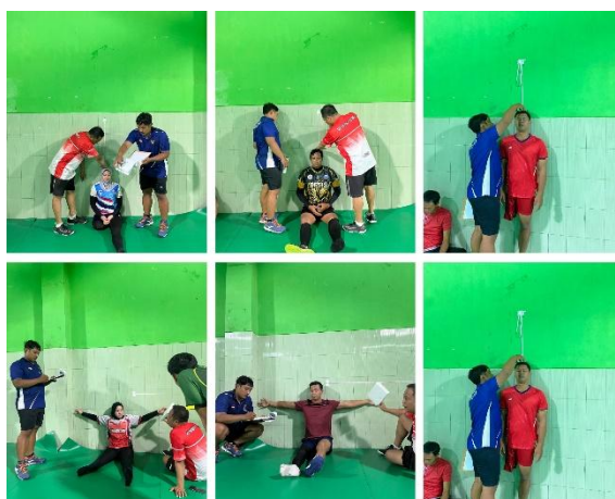
Gambar 2. Pelaksanaan Tes Antropometri pada Atlet Pelatnas Bolavoli Duduk Indonesia

Tes antropometri dilakukan untuk mendapatkan gambaran secara menyeluruh terhadap stuktur tubuh ( body structure profile ) yang relevan terhadap kebutuhan berdasarkan posisi dan peran atlet di lapangan (Casadei & Kiel, 2025; Cavedon dkk., 2018; Cherif dkk., 2022). Berdasarkan berbagai hasil kajian antropometri berperan besar dalam keberhasilan pada cabang olahraga bolavoli duduk (Cavedon dkk., 2022b; Marszalek dkk., 2015). Mengacu pada berbagai hasil studi yang ada maka komponen pengukuran yang dipilih meliputi: (1) tinggi badan dan berat badan, yang merupakan dasar untuk penghitungan indeks massa tubuh (IMT) dan rasio kekuatan terhadap berat badan yang berperan utama dalam menentukan efisiensi gerak, (2) tinggi duduk dan panjang lengan, untuk memetakan jangkauan vertikal dan horizontal dalam aktivitas blocking dan smashing , (3) rentang kedua lengan ( arm span ), menjadi salah satu komponen yang berguna untuk menentukan kemampuan jangkauan area permainan dan efektivitas pertahanan.