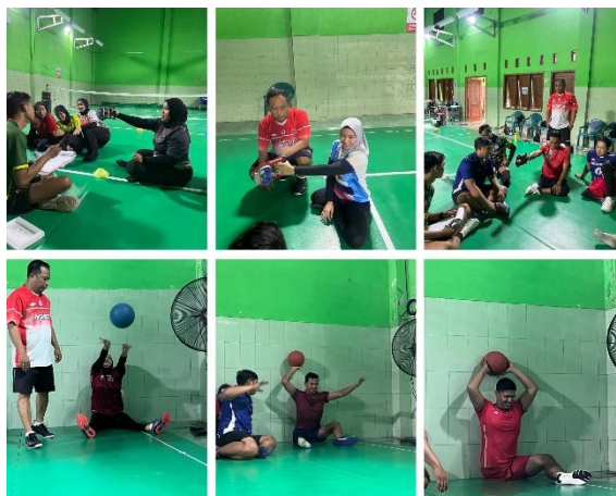
Gambar 3. Pelaksanaan Tes Kondisi Fisik pada Atlet Pelatnas Bolavoli Duduk Indonesia