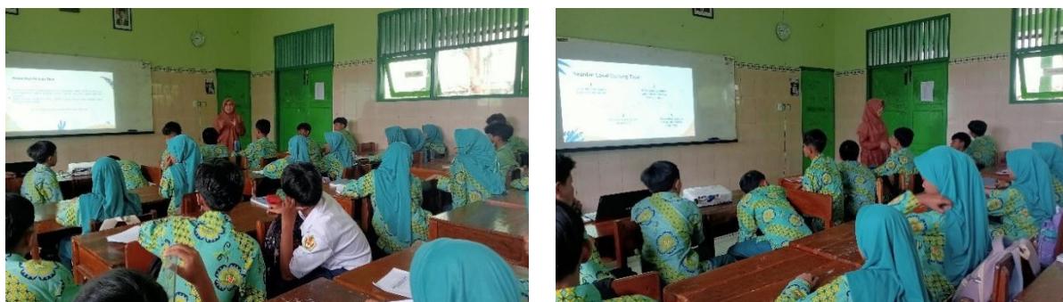
Gambar 2. Kegiatan penyampaian materi

Pada pertemuan tahap 1 juga dilaksanakan penjelasan Materi IPA topik aliran energi yang diintegrasikan dengan kearifan lokal Gunung Tidar. Dokumentasi kegiatan pertemuan 1 disajikan pada Gambar 2.