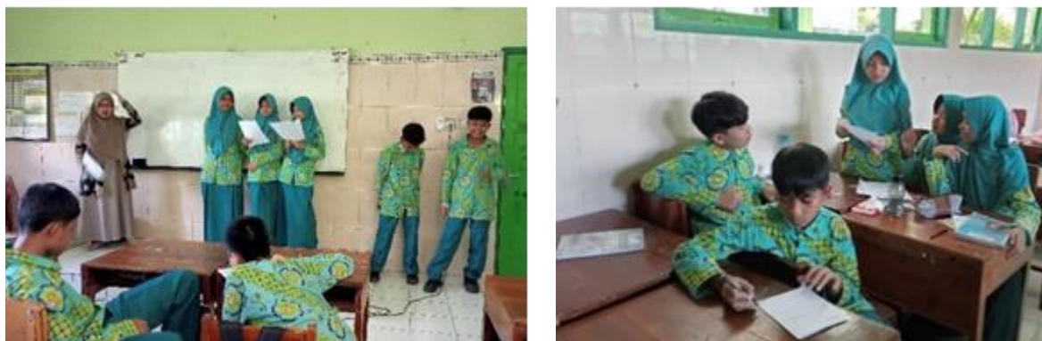
Gambar 4. Penyampaian asli diskusi kelompok

diskusi masing-masing kelompok melatih siswa untuk berani berkomunikasi dengan baik dikelas baik dengan guru maupun dengan siswa lainnya. Quratul'Aini, Hasibuan, & Gusmaneli (2024) Siswa akan berlatih berinteraksi dengan guru maupun teman sebaya, membuat mereka mengembangkan keterampilan sosial, seperti komunikasi, kerja sama, dan empati. Kegiatan penyampaian hasil diskusi kelompok dapat terlihat pada Gambar 4.