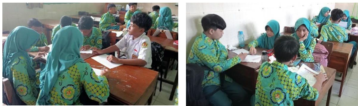
Gambar 3. Kegiatan diskusi kelompok

Kegiatan diskusi sebagai kegiatan bersama yang melibatkan sejumlah orang untuk membicarakan suatu persoalan, dengan tujuan menemukan berbagai alternatif yang dapat dijadikan solusi dalam menyelesaikan masalah (Baginda, 2018). Dalam kegiatan ini siswa mendiskusikan terkait dengan kasus yang ada di Gunung Tidar. Bersama teman kelompoknya mereka saling bertukar pendapat memecahkan permasalahan yang ada. Diharapkan melalui kegiatan ini, dapat melatih karakter siswa terkait dengan kerjasama atau gotong royong. Widada (2015) penerapan metode diskusi yang efektif melalui komunikasi antarpihak mampu meningkatkan kualitas belajar siswa dalam suasana belajar, sekaligus berkontribusi pada pembentukan karakter mereka. Cahyani, I. W. N., & Pratikno, A. S. (2024) metode diskusi mendukung penerapan pendidikan karakter serta mempercepat terbentuknya karakter. Diskusi sebagai pusat pemecahan masalah memungkinkan guru melihat karakteristik siswa yang muncul ketika diberi stimulus berupa studi kasus. Dalam proses ini, setiap siswa akan memperlihatkan karakter yang berbeda saat berdiskusi, sehingga guru dapat menentukan langkah yang sesuai untuk membentuk kepribadian siswa secara tepat (Abror, Rosuli, & Bahri, 2025). Kegiatan diskusi di pertemuan kedua terlihat pada Gambar 3.