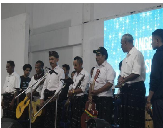
Gambar 9. Penampilan sanggar di panggung pentas inklusi: anggota sanggar tampil percaya diri membawakan repertoar musik tradisional Ngada