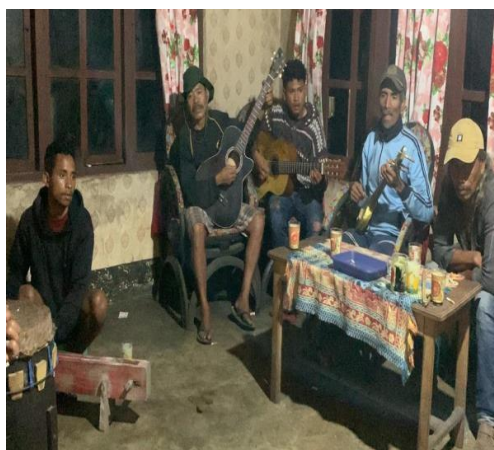
Gambar 3. Suasana malam latihan bersama di rumah salah satu anggota sanggar; tampak gitar akustik dan drum dimainkan bersamaan

Instrumentasi yang digunakan Sanggar Musik Lupa Susah mencerminkan hibriditas musikal yang khas. Gendang tradisional berbadan kayu dan bermembran kulit hewan berfungsi sebagai tulang punggung ritmik. Alat gesek bambu menghadirkan warna bunyi lokal yang membutuhkan kepekaan pendengaran dan ketelitian teknik. Sementara itu, gitar akustik telah mengalami proses indigenisasi, karena tidak dimainkan dengan