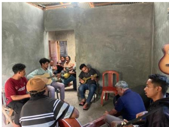
Gambar 6. Sesi persiapan instrumen: pemuda sanggar melakukan perawatan dan penyyetaman alat musik tradisional sebelum latihan