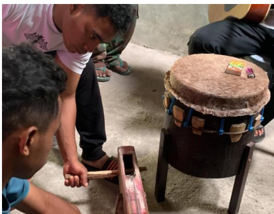
Gambar 8. Detail perawatan instrumen gendang tradisional; tampak membran kulit dan sistem pengikat tali khas instrumen Ngada

Pendekatan kolaboratif juga memperlihatkan pentingnya negosiasi antara pengetahuan akademik dan pengetahuan lokal. Tim pengabdian membawa pengalaman dalam teknik ensambel, struktur latihan, dan pengolahan dinamika, sedangkan anggota sanggar membawa pemahaman tentang rasa musikal lokal, konteks lagu, dan kebiasaan pertunjukan masyarakat. Chan dan Saidon (2021) menegaskan bahwa proses penciptaan musik tradisional baru bersama komunitas membutuhkan metode yang mampu menegosiasikan teknik komposisi dengan tradisi lisan masyarakat. Dalam kegiatan ini, negosiasi tersebut terjadi melalui percobaan, diskusi, pengulangan, dan keputusan bersama selama latihan.