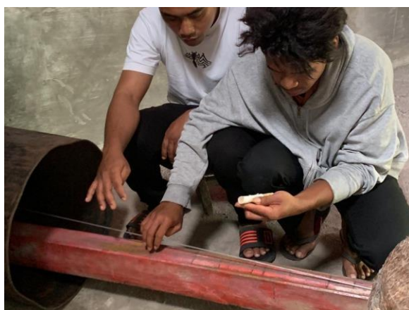
Gambar 7. Proses perbaikan instrumen tradisional berbahan kayu; tampak perhatian mendalam terhadap kualitas instrumen lokal