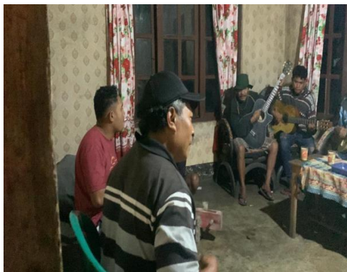
Gambar 2. Sesi latihan awal: anggota sanggar berlatih gitar akustik dan gendang tradisional bersama tim pengabdian

Hasil asesmen awal menunjukkan bahwa Sanggar Musik Lupa Susah memiliki komitmen kuat terhadap keaslian instrumen dan repertoar lokal. Komitmen tersebut terlihat dari penggunaan instrumen tradisional, pilihan lagu yang berakar pada tradisi Ngada, serta kebiasaan latihan yang dilakukan secara komunal. Akan tetapi, tim pengabdian juga menemukan sejumlah kebutuhan mendesak, terutama dalam sistematisasi latihan, penguatan teknik dasar, pengaturan ensambel, pengembangan aransemen, serta kesiapan tampil dalam ruang pertunjukan yang lebih formal dan inklusif. Temuan ini menunjukkan bahwa masalah utama mitra bukan terletak pada rendahnya motivasi budaya, tetapi pada keterbatasan akses terhadap pendampingan teknis dan artistik yang terstruktur.