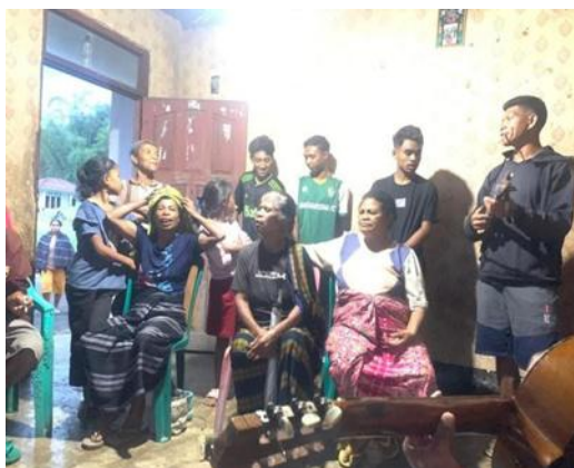
Gambar 5. Latihan gabungan yang melibatkan ibu-ibu dan generasi muda; tampak semangat lintas generasi dalam menjaga tradisi

Dalam sesi penguatan teknik instrumen, anggota yang lebih senior didorong untuk berperan sebagai pendamping bagi anggota yang lebih muda. Strategi ini membantu proses transfer pengetahuan karena anggota junior lebih mudah memahami teknik ketika melihat langsung praktik dari pemain yang telah mereka kenal. Pendekatan ini juga memperkuat relasi sosial di dalam sanggar. Pembelajaran tidak berlangsung secara vertikal dari akademisi kepada komunitas, tetapi bergerak secara horizontal melalui interaksi antara tim pengabdian, pemain senior, dan anggota muda.