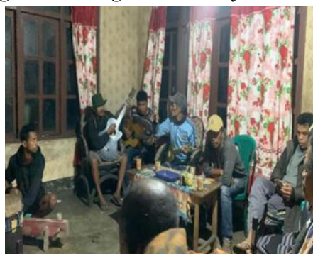
Gambar 4. Workshop ensambel malam hari: lima anggota sanggar memainkan gitar, gendang, dan instrumen perkusi dalam formasi melingkar

Pada tahap workshop, tim pengabdian menerapkan pendekatan bertahap melalui demonstrasi, praktik langsung, pengulangan, koreksi bersama, dan refleksi singkat setelah latihan. Pola ini lebih sesuai dengan karakter pembelajaran musik tradisional yang banyak berlangsung melalui pendengaran, pengamatan, peniruan, dan pengalaman tubuh. Dong et al. (2025) menunjukkan bahwa transmisi musik tradisional dan ritual sering berlangsung melalui pembelajaran informal, mentoring komunitas, pengulangan, dan partisipasi langsung dalam praktik budaya. Dengan demikian, pendampingan tidak dilakukan melalui ceramah teknis yang jauh dari kebiasaan komunitas, tetapi melalui proses belajar bersama yang dekat dengan cara kerja musikal masyarakat.