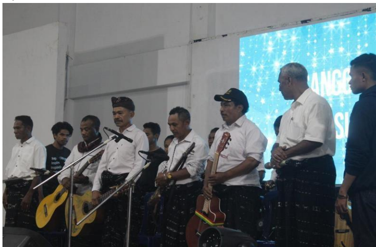
Gambar 10. Sanggar Musik Lupa Susah tampil di atas panggung pentas inklusi; para anggota mengenakan pakaian adat Ngada sambil memainkan instrumen tradisional dan akustik

Hal ini mengonfirmasi bahwa pendampingan teknis, apabila dilakukan dengan pendekatan partisipatif, dapat memperkuat kesiapan komunitas tanpa mengurangi otonomi artistiknya.