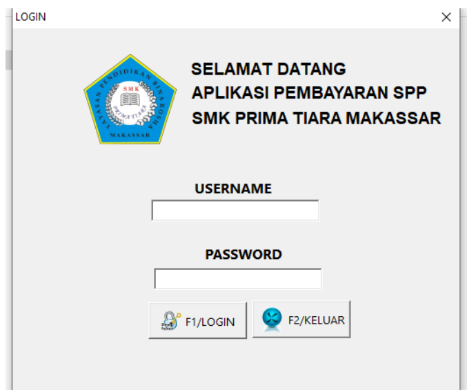
Gambar 3. Tampilan login Aplikasi

Aplikasi pembayaran SPP sudah berhasil dibuat dan install. Langkah awal untuk menggunakan aplikasi ini terlebih dahulu pengguna harus login. Gambar 3. menunjukkan tampilan login aplikasi.