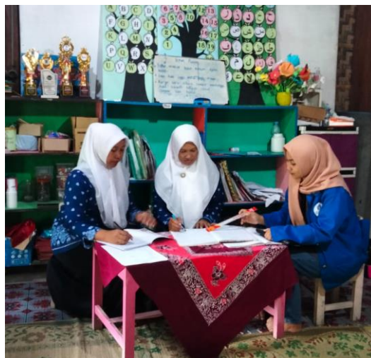
Gambar 9. Kegiatan evaluasi pada pertemuan ketiga