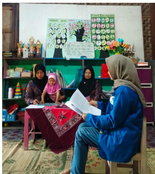
Gambar 2. Dokumentasi pertemuan kegiatan pertama materi pembukuan dan penyusunan laporan keuangan

Berikut ini dokumentasi atas kegiatan pada pertemuan pertama dan kedua :