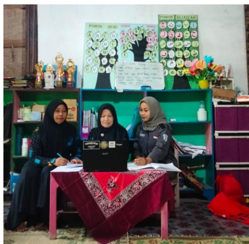
Gambar 3. Pertemuan kedua pendampingan penyusunan laporan keuangan dengan menggunakan Microsoft Excel