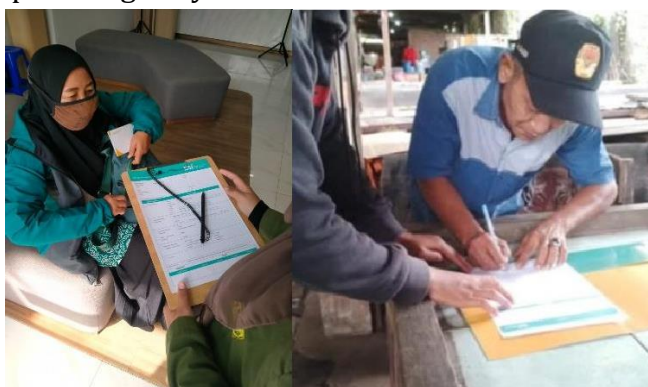
Gambar 4. Proses Pengajuan KUR

Setelah Nomor Induk Berusaha (NIB) berhasil diterbitkan bagi masing-masing peserta, kegiatan pengabdian tidak berhenti pada aspek legalitas semata. Sebaliknya, program ini langsung dilanjutkan dengan konsultasi lanjutan yang difokuskan pada persiapan pengajuan Kredit Usaha Rakyat (KUR), khususnya pembiayaan berbasis syariah yang ditawarkan oleh Bank BSI. Langkah ini menunjukkan bahwa pendampingan yang dilakukan bersifat holistik dan berkelanjutan, tidak hanya menyentuh sisi administratif usaha, tetapi juga memperluas akses pelaku UMKM terhadap dukungan pembiayaan yang legal dan sesuai prinsip keuangan syariah.