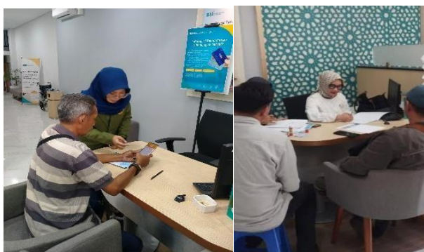
Gambar 2. Pemaparan NIB dengan Nasabah

Kegiatan ini diawali dengan pemaparan singkat dari pihak bank mengenai pentingnya legalitas usaha dalam dunia bisnis saat ini, khususnya terkait dengan peluang mendapatkan pembiayaan melalui program Kredit Usaha Rakyat (KUR) berbasis syariah. Pemaparan tersebut menjadi pemicu munculnya berbagai pertanyaan, tanggapan, dan refleksi dari para pelaku UMKM yang sebelumnya belum menyadari sepenuhnya pentingnya memiliki Nomor Induk Berusaha (NIB) secara resmi.