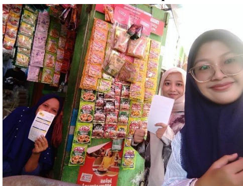
Gambar 1. Melakukan Identifikasi Usaha Nasabah

Tahapan awal dalam kegiatan ini adalah discovery, yaitu proses identifikasi potensi dan hambatan yang dihadapi pelaku UMKM (Witari et al., 2025). Hasil observasi dan wawancara menunjukkan bahwa sebagian besar pelaku usaha belum memiliki pemahaman menyeluruh mengenai manfaat NIB, bahkan beberapa di antaranya menganggap bahwa legalitas usaha hanya diperlukan untuk usaha berskala besar. Padahal, sesuai dengan regulasi pemerintah, setiap pelaku usaha termasuk usaha mikro yang diwajibkan untuk memiliki NIB sebagai dasar hukum operasional. Melalui diskusi kelompok terarah (FGD) yang dilakukan bersama pihak Bank BSI, fasilitator, dan pelaku UMKM, diperoleh gambaran bahwa sebagian besar pelaku usaha memiliki antusiasme tinggi untuk mengembangkan usahanya secara legal, namun terhambat oleh kurangnya literasi digital dan pemahaman teknis terkait pendaftaran OSS.