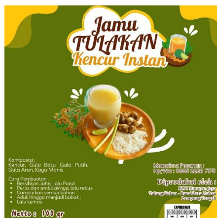
Gambar 4. Design Logo Produk Jamu

Dari nama tersebut, terpilih yakni TULAKAN oleh pihak desa dan KWT Harapan Jaya. Hasil kesepakatan rebranding nama produk, maka disusunlah alternatif logo kemasan. Dari beberapa alternatif logo yang telah disusun, maka KWT Harapan Jaya memilih 1 logo yang nantinya akan dibuatkan stiker kemasan produk lokal Desa Tulung Kakan. Adapun logo yang terpilih, bisa dilihat di Gambar 4 .