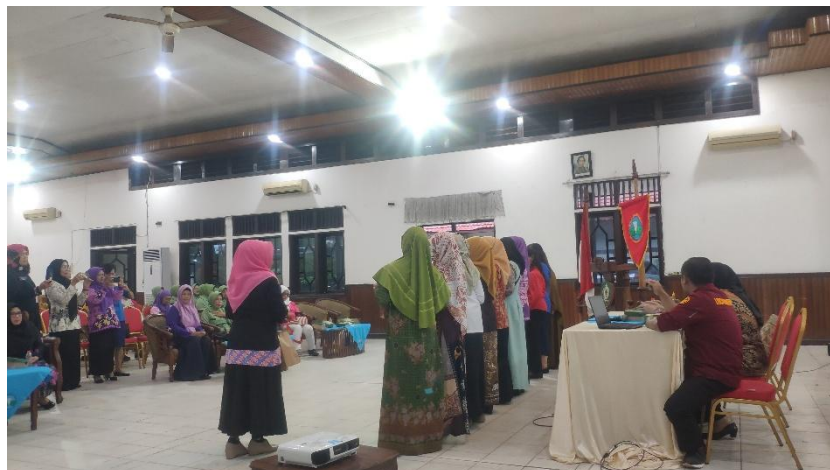
Gambar 4. Peserta Melakukan Simulasi Permainan

Sesi terakhir berfokus pada komunikasi efektif antara orang tua dan anak. Fasilitator menjelaskan bahwa komunikasi yang hangat, responsif, dan penuh empati sangat penting dalam membangun hubungan emosional yang kuat dan mendukung perkembangan psikologis anak. Peserta diberi simulasi percakapan dengan teknik mendengar aktif, memberi pujian, dan menghindari bentakan saat menghadapi perilaku anak (Al Humaerah dkk., 2024). Melalui latihan bermain peran, peserta belajar menyampaikan pesan dengan lembut dan mendidik, sekaligus mendengarkan anak secara penuh perhatian.