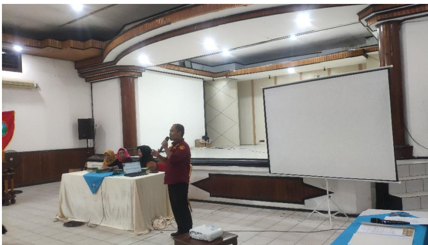
Gambar 2. Sambutan Tim Dosen Universitas Darwan Ali

Setelah sambutan, pada Gambar 2. tim pengabdian memperkenalkan narasumber, menjelaskan alur kegiatan, dan bertanya kesiapan peserta. Beberapa peserta menyampaikan secara terbuka bahwa mereka belum pernah mengikuti pelatihan yang membahas gizi, stimulasi, dan komunikasi secara terpadu, sehingga menunjukkan pentingnya kegiatan ini sebagai sarana belajar baru yang aplikatif dan mudah diterapkan dalam kehidupan sehari-hari sebagaimana juga disampaikan pada artikel (Anne Agustina Suwargiani dkk., 2024).