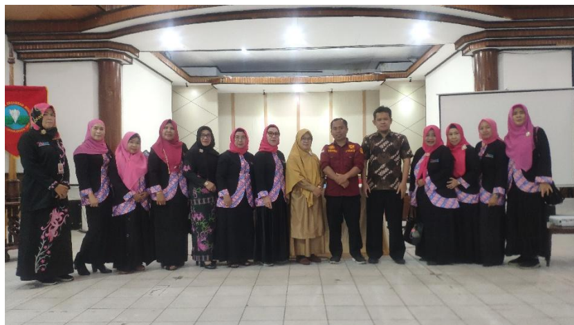
Gambar 5. Foto Bersama antara Tim Dosen Universitas Darwan Ali dengan Peserta

Peserta diberi kesempatan menyampaikan testimoni, yang umumnya menunjukkan rasa syukur dan semangat baru dalam menjalankan peran sebagai ibu dan pengasuh anak.