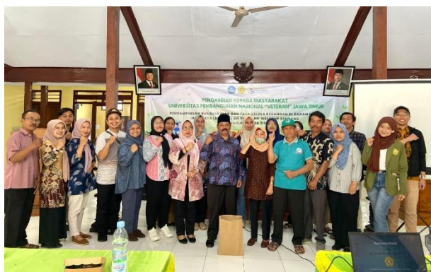
Gambar 1. Foto Bersama tim pengabdian, pengurus BUMDes & perangkat desa

Masyarakat menyatakan kesiapan untuk berkontribusi dalam penyediaan pakan hijauan, tenaga kerja, serta sistem bagi hasil yang sesuai kemampuan warga.