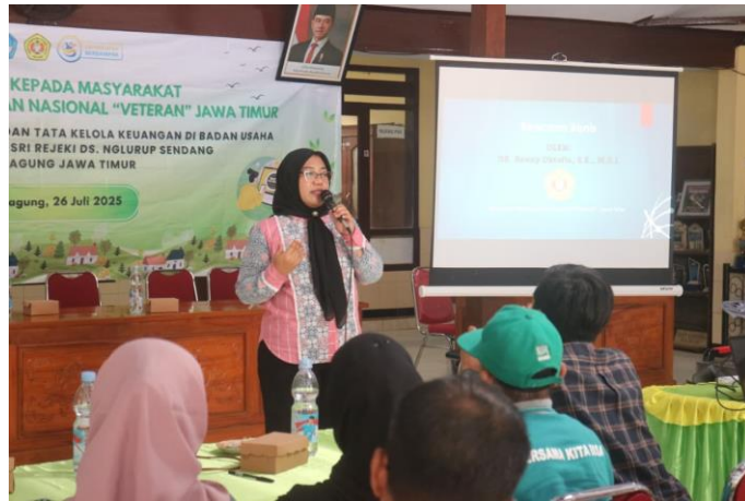
Gambar 2. Sesi pelatihan dan pendampingan